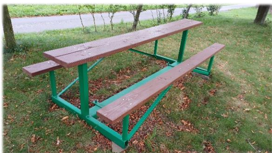
Renovace laviček napříč obcí

V průběhu roku provádíme drobné opravy po celé obci na všech potřebných místech.