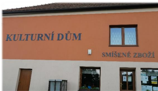
Označení na KD a obchodě