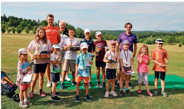
Vyhlášení vítězů dětského turnaje v rámci červencového golfového tábora.

Jedním z takových turnajů byl Texas Scramble, který se hraje ve dvojicích. V tomto systému hry si hráči po odehrání vyberou míček, co skončil v lepší poloze, a pokračují ve hře z tohoto místa. V červenci byl uspořádán po delší době i „Noční turnaj“, který se hrál v prvním kole ještě za světla formou Texas Scramble a po setmění pod hvězdnou oblohou podle pravidel pro Foursome (hráči hrají jedním s míčkem a v odpalech se střídají). Noční pohled z výšky na hřiště