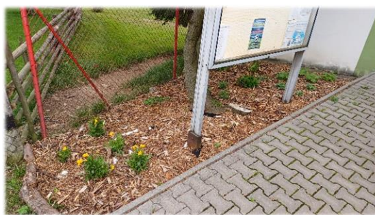
Výsadba u autobusových zastávek