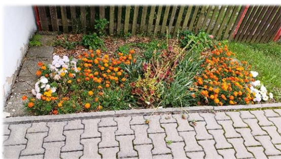
Výsadba u autobusových zastávek